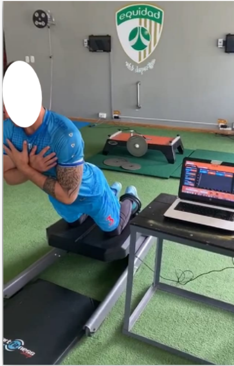
Figura 1. Evaluación mediante sistema Nordbord