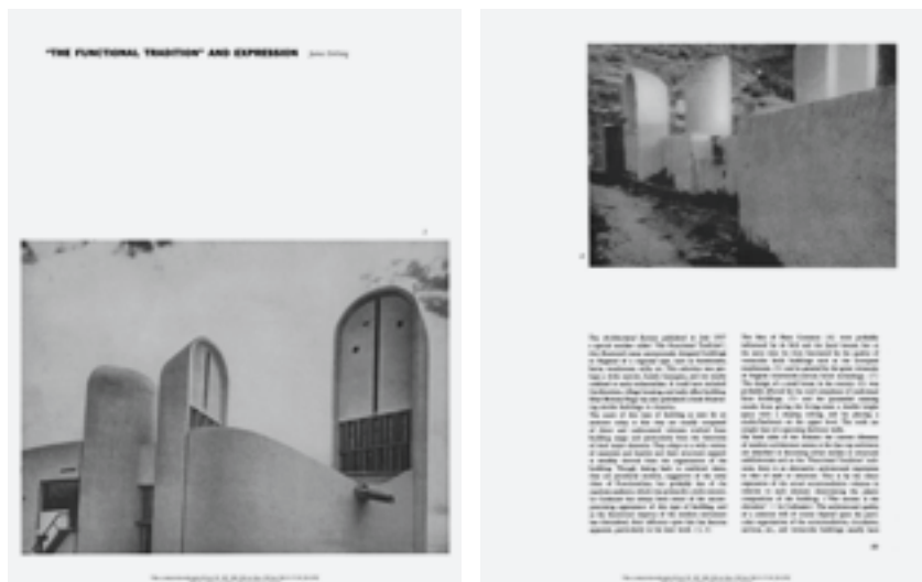
Fig. 07 . STIRLING, James. “‘The Functional Tradition’ and Expression”. Perspecta . 1960, núm. 6, p. 88 y 97.

para él, es un asunto que concierne más al estilo. Afirmar Stirling que Le Corbusier siempre ha sido consciente de esta ausencia de compromiso con la apariencia en estos edificios y que conforme el ímpetu teórico del movimiento moderno ha disminuido, la influencia de estas arquitecturas se ha vuelto más evidente, sobre todo en sus últimos trabajos, a los que se refiere a través de las ilustraciones a pie de página del artículo: Ronchamp y las Jaoul houses, de las que Stirling había publicado un artículo en The Architectural Review en 1955, el conocido “Garches to Jaoul”.