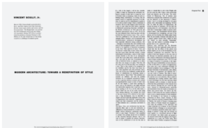
Fig. 05. SCULLY, Vincent. "Modern Architecture: Toward a Redefinition of Style". Perspecta . 1957, núm. 4, p. 4-5.

encomendándose al Modern Architecture de Hitchcock y al International Style –de Hitchcock y Johnson– como referencias iniciales en su objetivo de redefinir el concepto de estilo para la arquitectura moderna, ambición que pasa por no atacarlo, tarea que sería fácil según el autor, siendo más provechoso en su lugar admitir su utilidad para señalar similitudes entre obras. Las referencias a Hitchcock y Johnson son testimoniales y Scully abunda mucho más en el Space, Time and Architecture de Giedion, libro fundamental, en su opinión, para toda una generación que había sido muy precavida en su mirada a la historia y que ahora se acercaba a ella de nuevo. De nuevo nos encontramos ante un artículo donde aparece la posición de Perspecta en su recuperación de la historia como parte de la agenda que la propia universidad de Yale trabajaba por incorporar de nuevo a su programa académico, y lo hace como veremos en una revisión crítica de esa historia de –en palabras de Scully ahora– héroes y mártires que Giedion propone, pero en el fondo, como sucedía con la auto-crítica de Hitchcock a su Estilo Internacional, apoyándose en esa misma capacidad heroica de los maestros ahora en su fase de madurez.