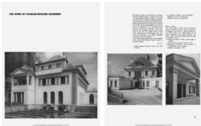
Fig. 06. COX, Warren J. "The Work of Charles-Edouard Jeanneret". Perspecta . 1960, núm. 6, p 28-29.

las premisas de la recuperación de la historia en el programa académico de la enseñanza de arquitectura en Yale, junto a la continua presencia del Estilo Internacional en esas mismas páginas, podría entenderse efectivamente que, tal como sosteníamos como tesis de este artículo, Perspecta allanó el camino hacia el postmodernismo con su acercamiento a la historia a través de estos artículos, ya que la validación vendría servida no por un medio comercial sino por una revista vinculada a una institución académica de gran prestigio, como es la universidad de Yale, desde la que se ejerció esa posición de liderazgo que tanto influiría en la siguiente generación de arquitectos.