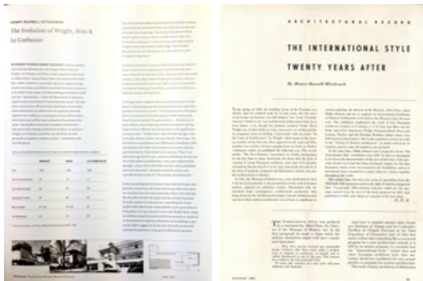
Fig. 01. Artículos de Henry-Russell Hitchcock para el número 1 de Perspecta del año 1952 (izquierda) y para el de agosto de 1951 de Architectural Record (derecha).

veinte años más tarde”, en 1951 2 en la revista Architectural Record , y que publica también en Perspecta , donde ya en el primer número de 1952 aparece un artículo suyo 3 sobre la evolución de los tres maestros en el que anima a los estudiantes a no obsesionarse con hacer una primera obra maestra pronto (haciendo referencia a lo tardío de la primera obra maestra de Mies, Le Corbusier o Wright, respectivamente) y entender esos años como un periodo de formación necesario donde satisfacer las necesidades del cliente, anteponiéndolas a la expresión propia del genio individual. En dicho artículo, Hitchcock se fija además en las primeras obras de los tres, anotando las influencias neoclásicas a través de Schinkel en Mies, las de Le Corbusier, que aparecen luego en el texto de los editores de la revista en el mismo número, y el proyecto de Wright para un concurso de una biblioteca y museo en Milwaukee, justo cuando éste había abandonado la oficina de Sullivan, el mismo año de la exposición de la World’s Columbian Exhibition de Chicago, 1893, donde el arquitecto americano diseña una gran columnata en fachada para un edificio que, en definitiva, parece un palacio dieciochesco.