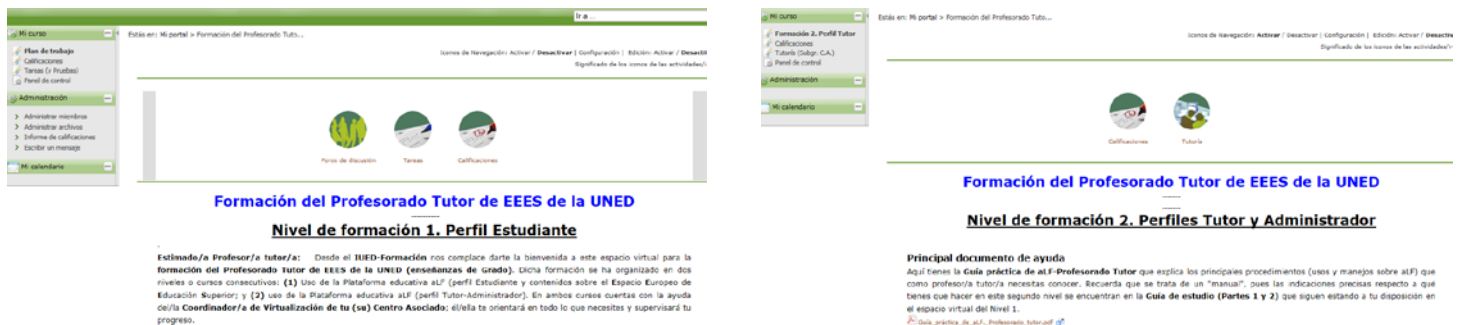
Figura 1. Vista de los dos niveles del Módulo I: Formación del PT de EEES de la UNED