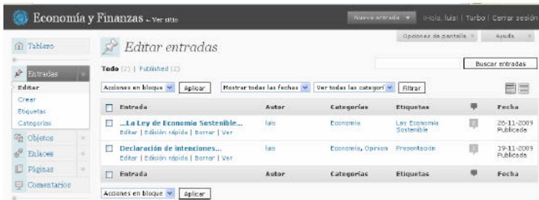
Figura 2. Pantalla de edición de los comentarios en la Plataforma Inlumine