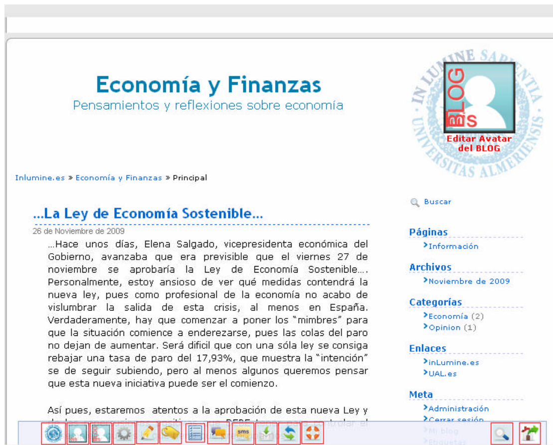
Figura 1. Pantalla inicial de la Plataforma Inlumine. Resumen del perfil

relacionados de manera informal y el estudiante no se siente obligado a aprender. Sin embargo, se le motiva a hacerlo.