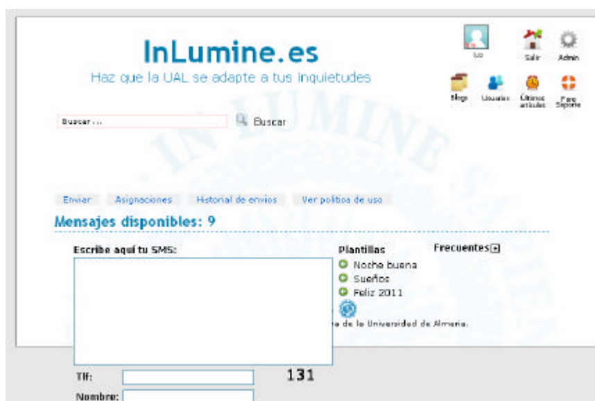
Figura 5. Herramientas de comunicación. Envío gratuito de mensajes sms.